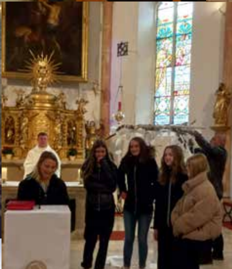
Vorstellung der Firmlinge