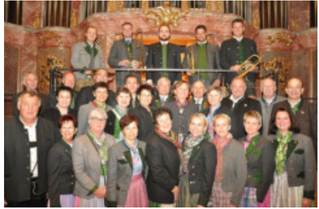
Kirchenchor Donnersbach in Graz