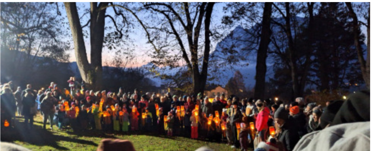
Martinsfest in Irnding