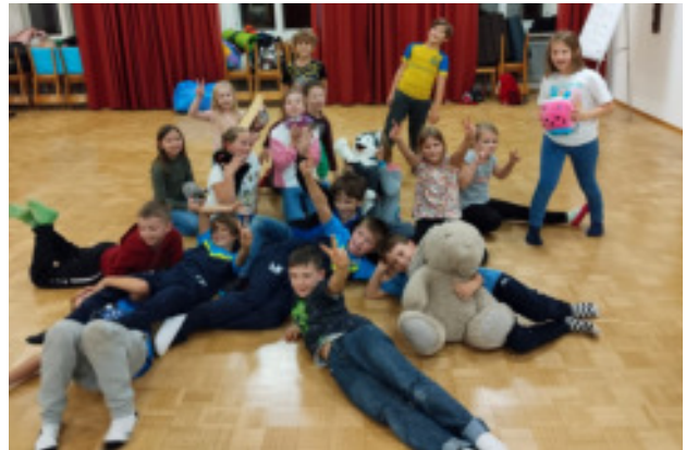
Erstkommunionkinder im Pfarrhof Irnding