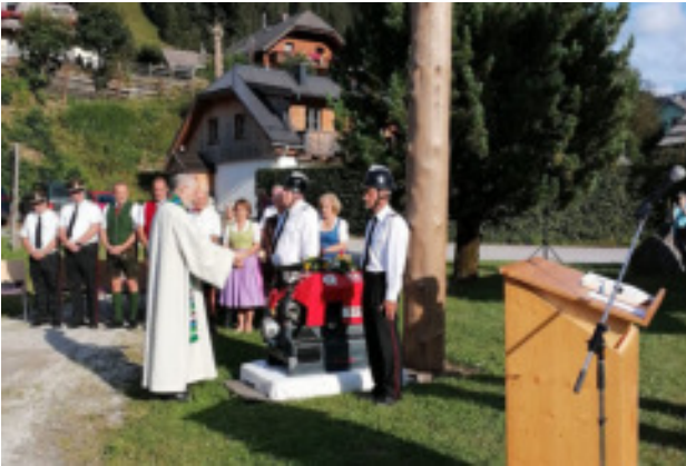
Spritzensegnung in Donnersbachwald