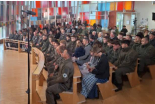
Fernsehmesse mit Militär in Aigen