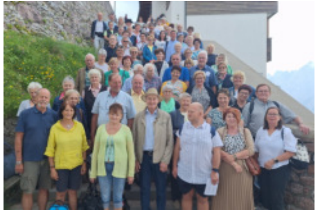
Wallfahrt nach Maria Lussari